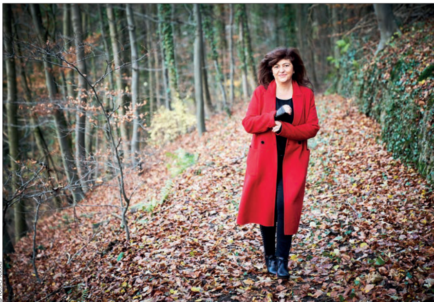
La compositora Albena Petrovic ha publicado "Sanctuary".

Un disco debe hacerse con intérpretes de absoluta confianza", afirma la compositora.